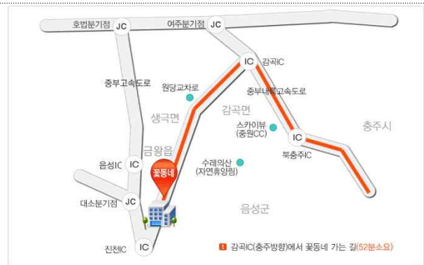
감곡IC(충주방향)에서 꽃동네 가는 길

주소 (27732) 충북 음성군 음성읍 꽃동네길 138 꽃동네 사랑의연수원