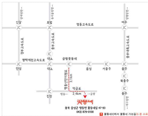
꽃동네IC에서 꽃동네 가는 길