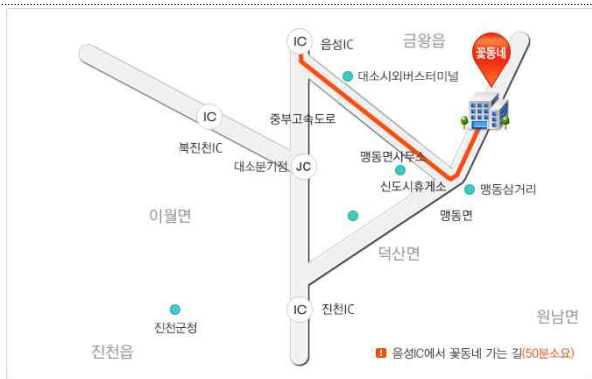
음성IC에서 꽃동네 가는 길