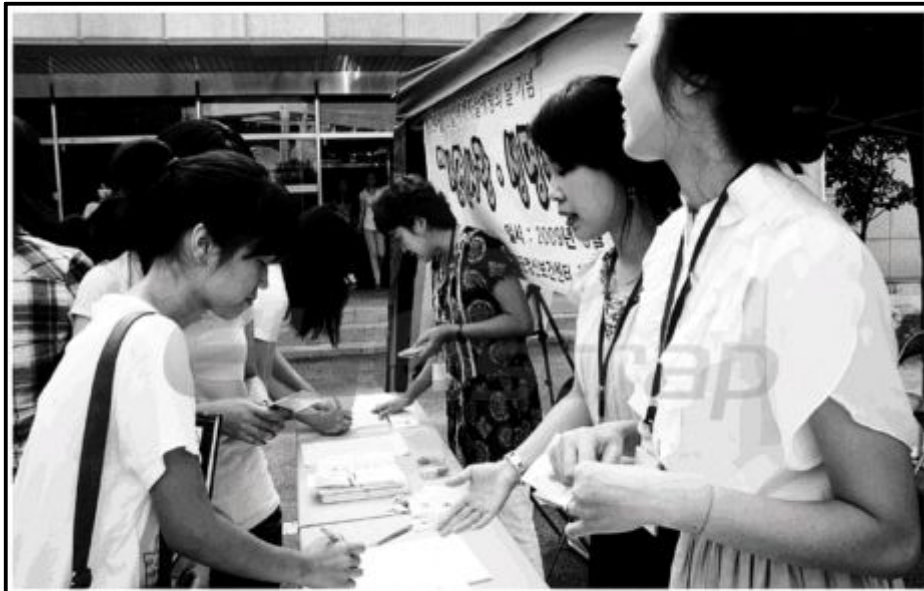
꽃동네대 생명사랑 서약운동 꽃동네현도사회복지대는 9일 세계 자살 예방의 날을 맞아 청원군정신보건센터와 '생명사랑 생명존중 서약운동'을 가졌다. 이번 행사는 사회적 문제로 대두되고 있는 자살 문제의 주요한 원인이 생명존중 의식 결여임을 지적하고 그 예방을 위해 마련됐다.