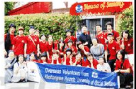
꽃동네대가 7일 해외봉사단 발대식을 갖고 필리핀 등 4개 국가에 봉사대원 13명을 파견하고 아동복지시설과 노인복지시설에서 활동을 한다.

대학관계자는 "학생들에게 기아, 빈곤, 질병, 환경과 같은 세계 문제에도 관심을 갖고 직접 체험할 수 있는 기회를 확대해 사회적인 약자를 위해 사랑을 실천토록 지도할 예