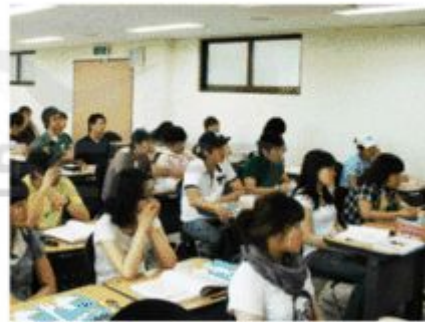
꽃동네대 집중 영어캠프에 참가한 학생들이 영어강의를 듣고 있다.