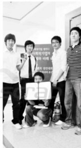
꽃동네현도사회복지대의 소모임인 'α'가 '2009 소셜벤처 경연대회'에서 우수상을 수상하고 기념촬영을 하고 있다.