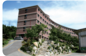
| 마리아의 집 |