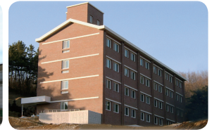
| 요셉의 집 |